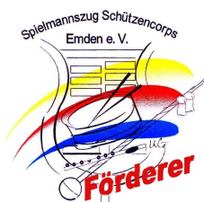
Anstecknadel für aktive Förderer

Doch das war nicht immer so. Im Jahr 2005 stand der Spielmannszug durch zahlreiche Abgänge und einem hohen Altersdurchschnitt kurz vor dem Aus.